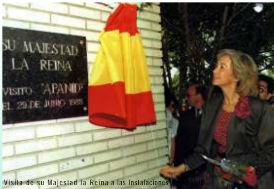
Visita de su Majestad la Reina a las Instalaciones APANID

APANID, es una entidad que nace en 1968, cuenta con personalidad jurídica propia desde 1971 y está declarada de Utilidad Pública desde 1975..