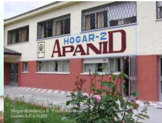
Hogar-Residencia II "Prado" Getafe-APANID

Su ámbito de actuación es el de la Comunidad de Madrid, aunque la mayor parte de sus asociados residen en la Zona Sur de Madrid (Corona Metropolitana y distritos del sur de Madrid municipio) y principalmente de Getafe.