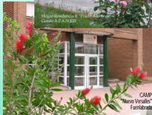
CAMP "Nuevo Versalles" Fuenlabrada

La Asociación, mediante la agrupación de familias de personas con discapacidad intelectual y personas sensibilizadas con este problema, tiene como misión y objetivo básico defender los derechos y mejorar la calidad de vida de las personas con discapacidad y de sus familias, en el ámbito donde residan, orientado siempre por los principios de integración social y de normalización.